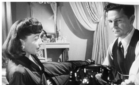
1948 L'ENFER DE LA CORRUPTION (Force of Evil) d'Abraham Polonsky avec Mary Windsor