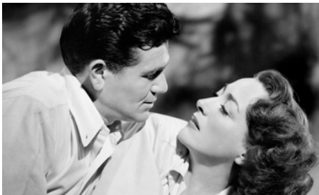
1946 HUMORESQUE (Humoresque) de Jean Negulesco avec Joan Crawford