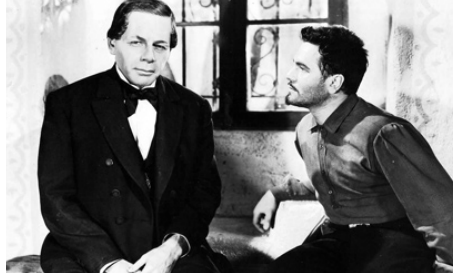
1939 JUAREZ (Juarez) de William Dieterle avec Paul Muni