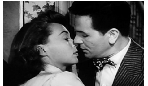
1947 SANG ET OR (Body and Soul) de Robert Rossen avec Lilli Palmer