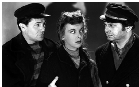
1941 LE VAISSEAU FANTÔME (The Sea Wolf) de M. Curtiz avec Ida Lupino, Edward G. Robinson