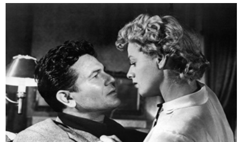
1951 MENACE DANS LA NUIT (He ran all the Way) de John Berry avec Shelley Winters