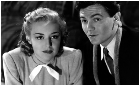
1946 L'ÉCOLE DU MARIAGE (Saturday's Children) de Vincent Sherman avec Anne Shirley