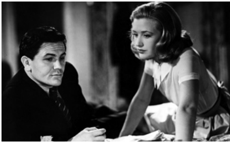
1939 QUATRE JEUNES FEMMES (Four Wives) de Michael Curtiz avec Priscilla Lane