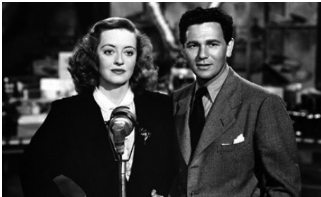
1944 HOLLYWOOD CANTEEN (Hollywood Canteen) de Delmer Daves avec Bette Davis