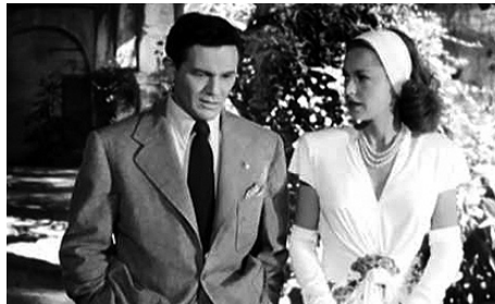
1946 MEURTRE AU PORT (Nobody lives forever) de Jean Negulesco avec Geraldine Fitzgerald