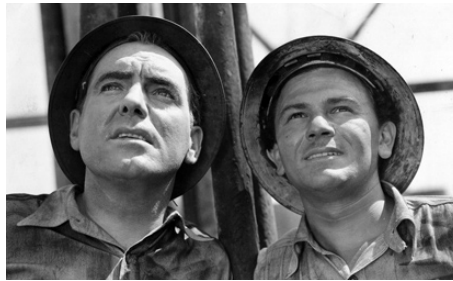
1940 L'OR NOIR (Flowing Gold) d'Alfred E. Green avec Pat O'Brien