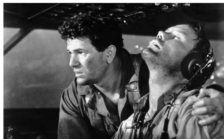
1943 AIR FORCE (Air Force) de Howard Hawks avec Ray Montgomery