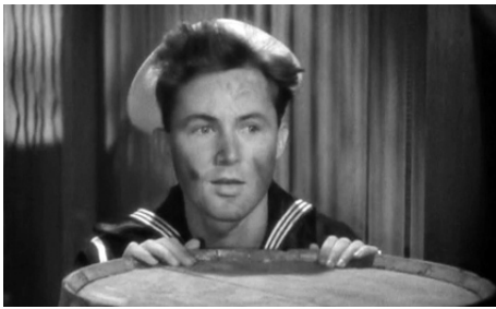
1933 PROLOGUE (Fool Parade) de Lloyd Bacon (simple apparition)