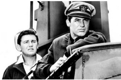
1943 DESTINATION TOKYO (Destination Tokyo) de Delmer Daves avec Cary Grant