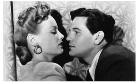
1944 ENTRE DEUX MONDES (Between two Worlds) de Delmer Daves avec Faye Emerson