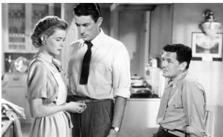
1947 LE MUR INVISIBLE (Gentleman's Agreement) d'Elia Kazan avec Dorothy McGuire, Gregory Peck