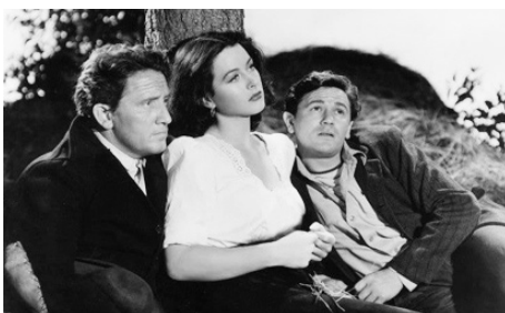
1942 TORTILLA FLAT (Tortilla Flat) de Victor Fleming avec Spencer Tracy, Hedy Lamarr