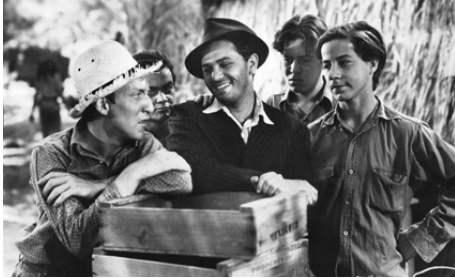
1938 JE SUIS UN CRIMINEL (They made me a Criminal) de Busby Berkeley avec les Dead End Kids