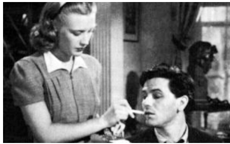
1936 RÊVES DE JEUNESSE (Four Daughters) de Michael Curtiz avec Priscilla Lane