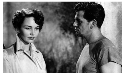
1948 LES INSURGÉS (We were strangers) de John Huston avec Jennifer Jones