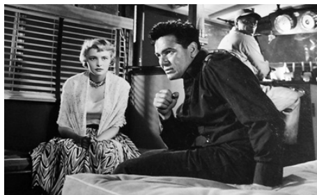
1950 TRAFIC EN HAUTE MER (The Breaking Point) de Michael Curtiz avec Patricia Neal