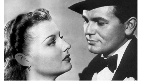
1939 LE CHÂTEAU DE L'ANGOISSE (Castle on the Hudson) d'Anatole Litvak avec Ann Sheridan