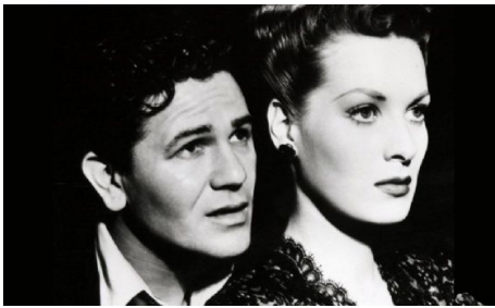
1943 L'ESPION D'HITLER (The fallen Sparrow) de Richard Wallace avec Maureen O'Hara