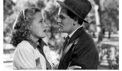
1939 FILLES COURAGEUSES (Daughters courageous) de Michael Curtiz avec Lola Lane