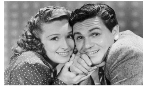
1938 BLACKWELL'S ISLAND de William McGann avec Rosemary Lane