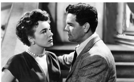
1949 LA BELLE DE PARIS (Under my Skin) de Jean Negulesco avec Micheline Presle