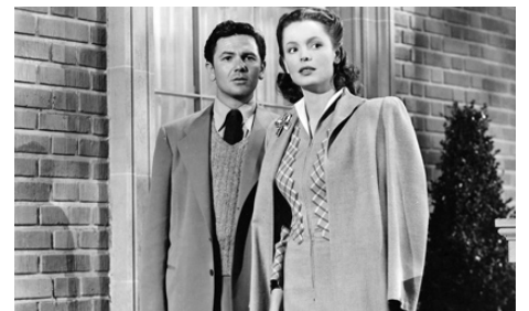
1941 DANGEROUSLY THEY LIVE de Robert Florey avec Nancy Coleman