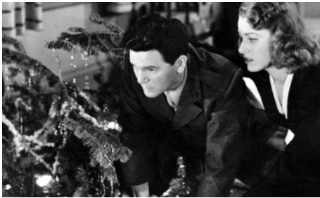
1945 LA NUIT SANS FIN (Pride of the Marines) de Delmer Daves avec Eleanor Parker