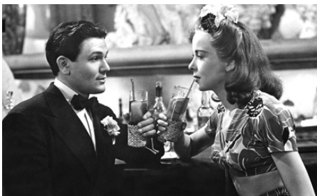
1940 OUT OF THE FOG d'Anatole Litvak avec Ida Lupino