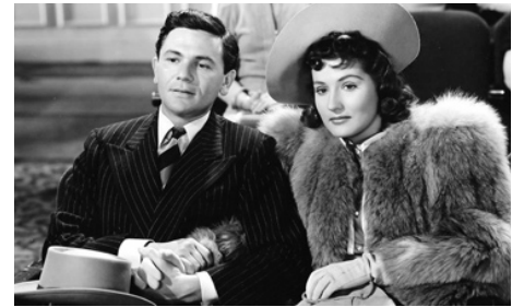
1940 EAST OF THE RIVER d'Alfred E. Green avec Brenda Marshall