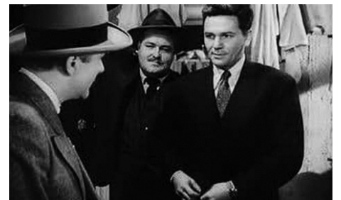
1943 REMERCIER VOTRE BONNE ÉTOILE (Thank your lucky Stars) de David Butler avec W. Conrad