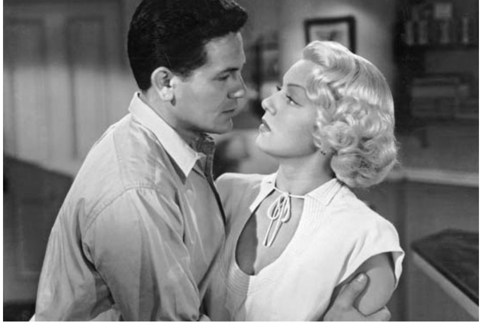
1946 LE FACTEUR SONNE TOUJOURS DEUX FOIS (The Postman always rings twice) de T. Garnett avec Lana Turner